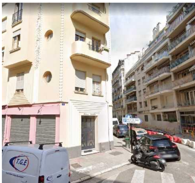
«Дом, в котором живет Сифр»

Да, он получил наше письмо с оригиналом протокола и переводом, так что его почтовый адрес у нас верный. У нас были в отношении этого определенные сомнения, так как из посольства мы получили адрес без номера квартиры - только название улицы и номер дома. А на фотографии по данному адресу расположен явно многоквартирный дом. Но! Оказалось, что номера дома и только фамилии адресата в Ницце достаточно ©